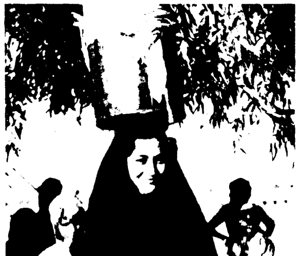
Een moderne 'Shub-ad'