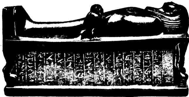
De ziele-vogel op bezoek bij het lichaam.

Indien de "ziele-vogel" heel de eeuwigheid bezig zou zijn met het zoeken van het lichaam zou dit een verschrikkelijke ramp betekenen.