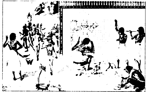
Zo werden de muurschilderingen gemaakt.