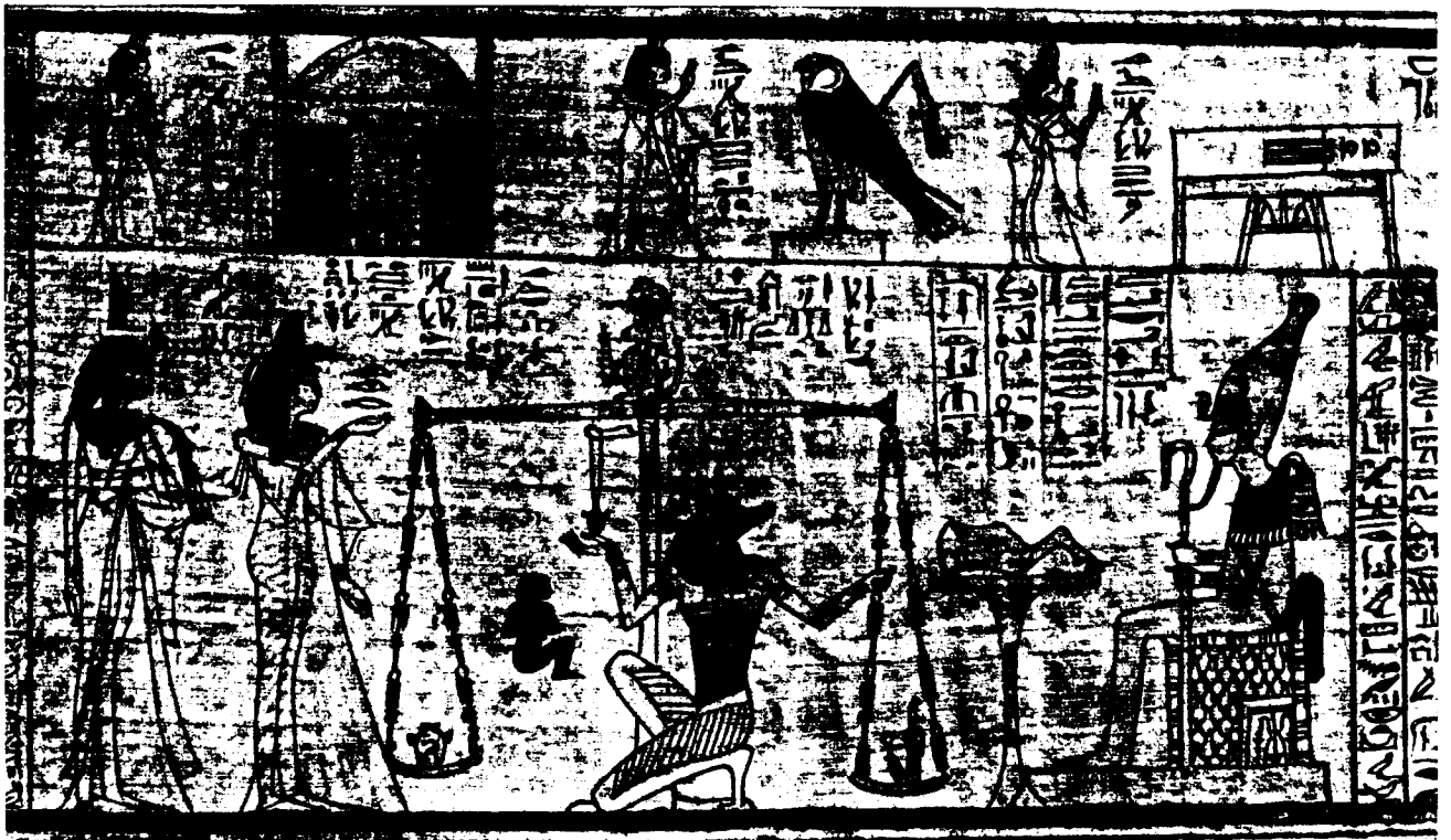
Egyptische voorstelling van het oordeel - Hart van de koning gewogen ten opzichte van de waarheid.