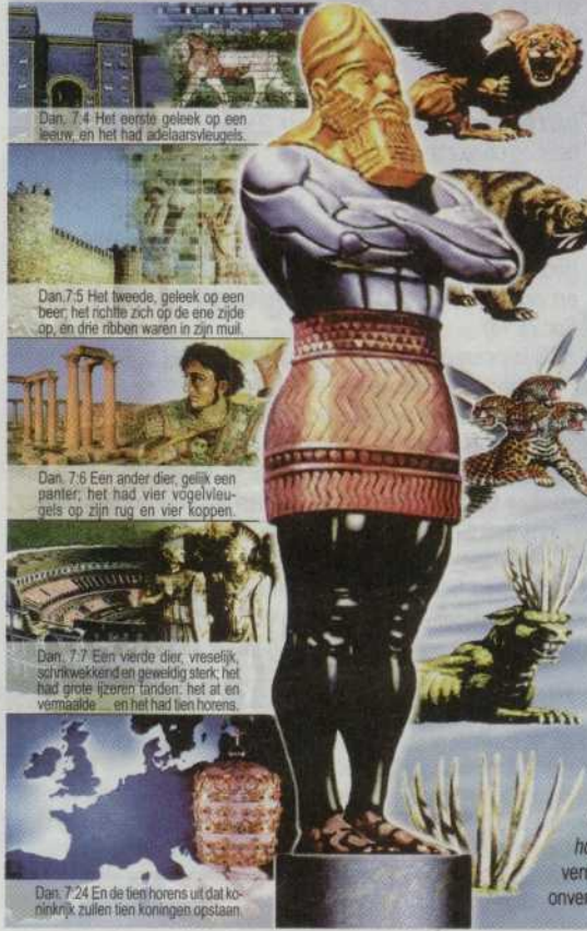
Dan. 7.4 Het eerste geleek op een leeuw, en het had adelaarsvleugels.

Meer dan 2600 jaar geleden voorspelde Daniël het ontstaan en de ontwikkeling van de grote wereldrijken n.l. Babylon, Medo-Perzië, Griekenland en Rome , en zelfs het hedendaagse Europa . In een droom zag de profeet een groot beeld welks lichaamsdelen de juiste volgorde van deze wereldrijken symboliseerde. "Het hoofd van dat beeld was van gedegen goud, zijn borst en armen waren van zilver, zijn buik en ledenen van koper, zijn benen van ijzer, zijn voeten deels van ijzer deels van leem" (Dan.2:32-33). Deze grote wereldrijken en hun unieke karakteristieken werden de profeet ook als roofdieren getoond. "Die grote dieren, die vier, zijn vier koningen die uit de aarde zullen opkomen" (Dan.7:17) "en zie, de vier winden des hemels brachten de grote zee in beroering" (Dan.7:2). Opb.17:15 verklaart dat "wateren" "natiën", "menigten, volkeren en talen zijn" . "Winden" stellen oorlogen voor (Jeremia 4:11-16). De vier winden des hemels, die de grote zee in beroering brachten, stellen de vreselijke oorlogen voor, waardoor deze koninkrijken hun macht verkeren.