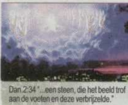
Dan. 2:34 "...een steen, die het beeld trof aan de voeten en deze verbrijzelde."

De profeet Daniel zag dat wanneer de mensen proberen de volken van Europa te verenigen en de wereld in toenemende mate geteisterd wordt door rampen en oorlogen, een grote steen het beeld aan zijn voeten zal treffen en het volledig zal vernietigen. Deze steen is een beeld van de wederkomst van Jezus Christus (Dan. 2:34,35; Psalm 18:32). Christus zal wederkomen op de wolken des hemels met al Zijn engelen, en iedereen zal dit zien (Openb. 1:7). Om de mensen op deze gebeurtenis voor te bereiden en hen te helpen te staan in het oordeel, waarschuwt God in Zijn liefde de mensheid door een laatste genadeboodschap die u vindt in Openb. 14:6-12.